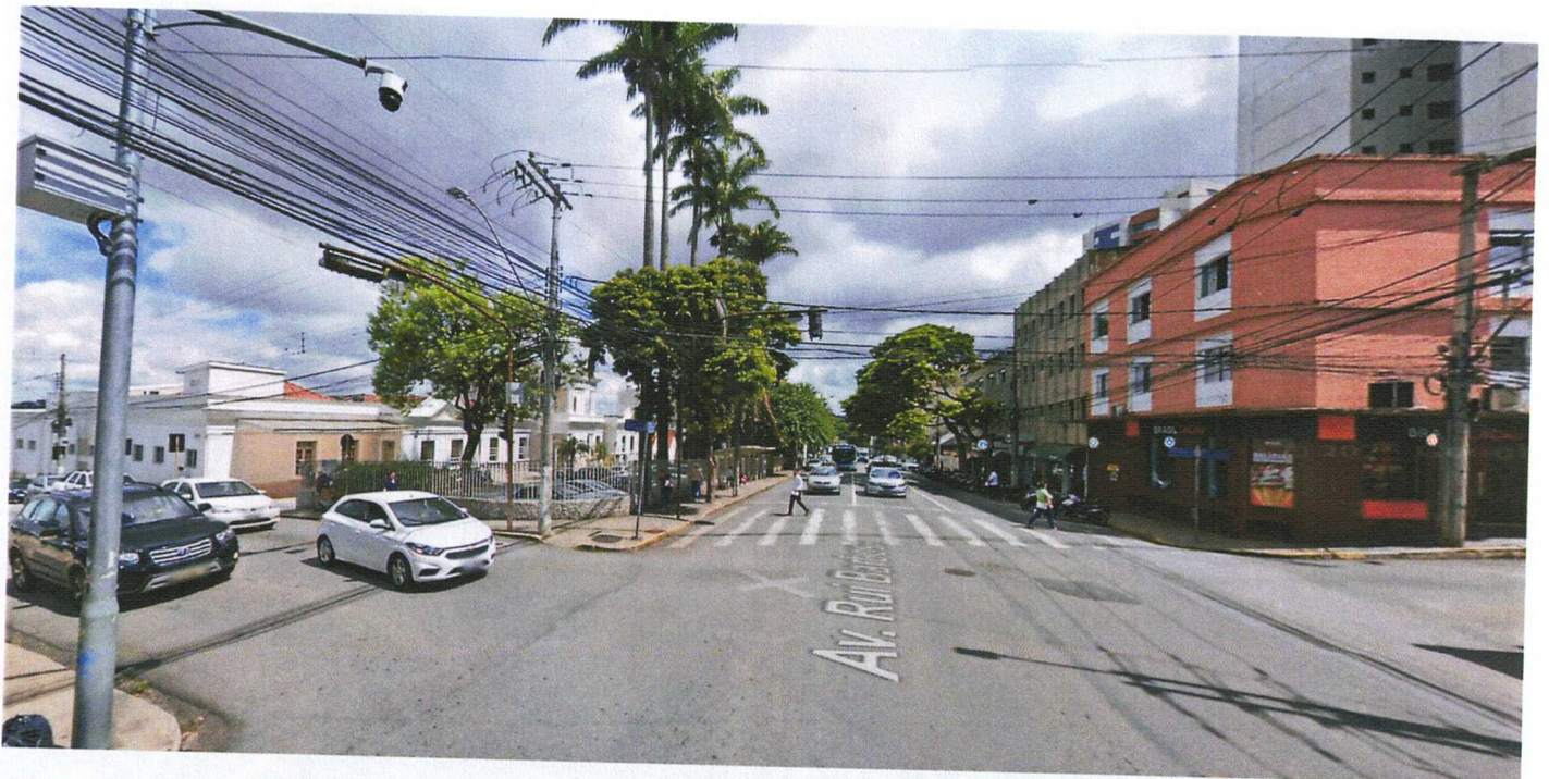
Av. Rui Barbosa