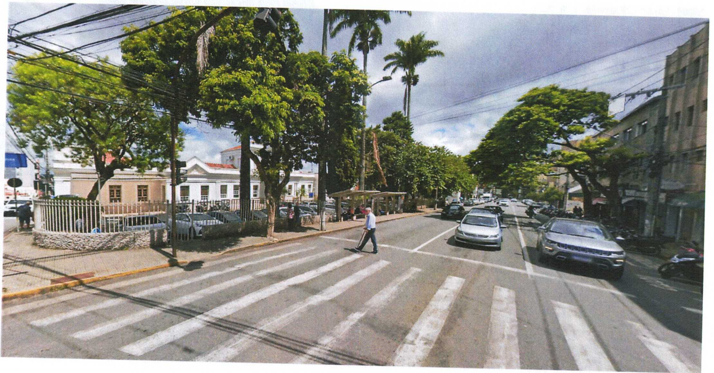
Av. Rui Barbosa